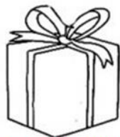
Всем подарки принесла: